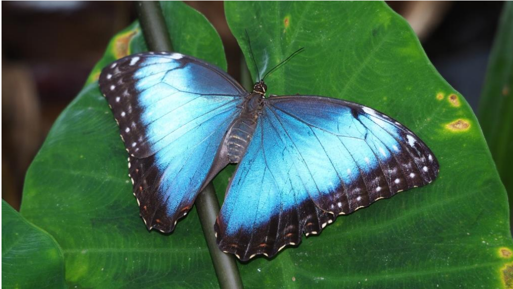
Tropische Schmetterlinge noch bis Ende Jänner im Tropenhaus