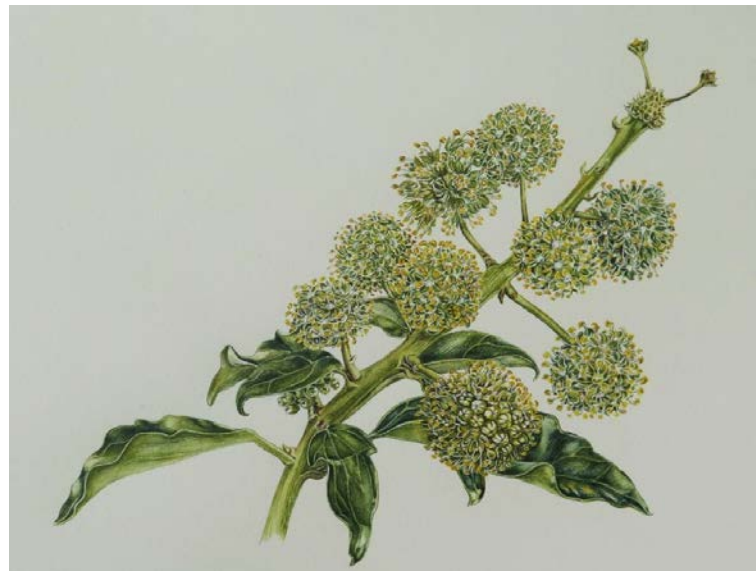
Botanische Illustrationen in Form von Aquarellen von Margit Riezinger Ausstellung September/Oktober