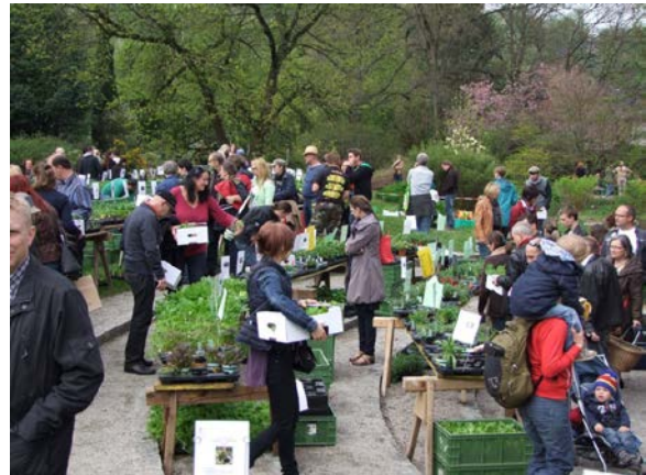
Am 8. April findet der traditionelle ARCHE NOAH-Markt statt – in Verbindung mit einem Raritätenmarkt oö. Gärtnereibetriebe