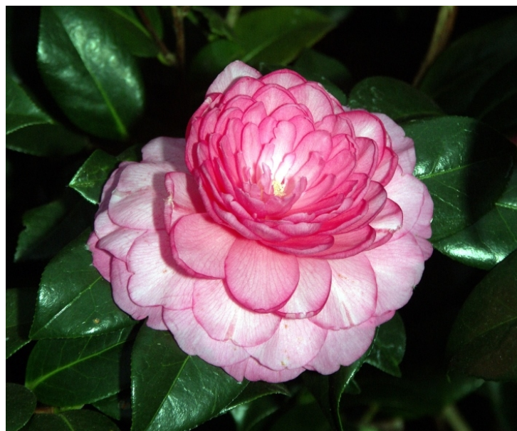
Kamelien-Ausstellung ab 20. Jänner