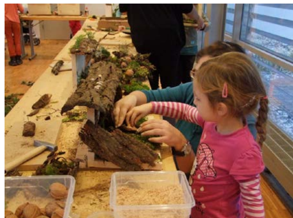
Mit Eifer bei der Sache: Kinder beim Bastelworkshop

Auch für das jüngere Publikum hat der Botanische Garten passende Angebote parat. Damit soll die Freude und das Interesse an der Natur, der Flora und Fauna gefördert werden. Auf dem Programm steht u.a. der Bodenworkshop „Was krabbelt denn da?“ , ein interaktiver Rätselcomic zu Gift-, Drogen- und Heilpflanzen , eine Reise zu den Elementen Erde, Feuer, Wasser und Luft , Basteln mit Naturmaterialien , ein Krippenbau-Workshop .