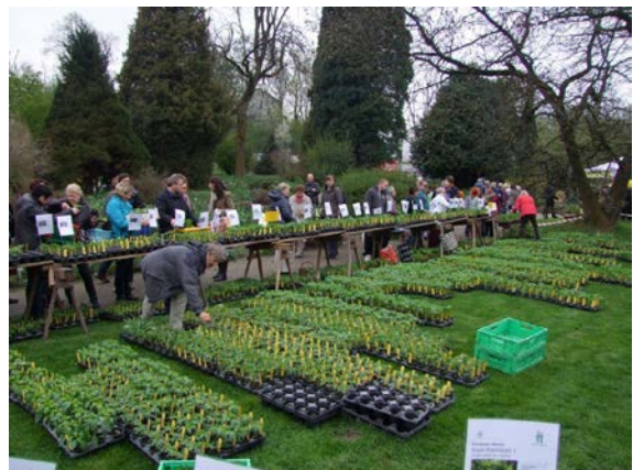
Alljährlich ein Fixpunkt bei Hobbygärtnern: der ARCHE NOAH-Markt

Sehr beliebt sind die Verkaufsausstellungen, die an einzelnen Tagen im Botanischen Garten stattfinden. Alljährliches Highlight ist der ARCHE NOAH-Jungpflanzenmarkt , der mit einer Gärtnerei-Raritätenbörse in Verbindung steht (7. April). Auch Orchideen, Bonsais und Sommerstauden können erstanden werden.