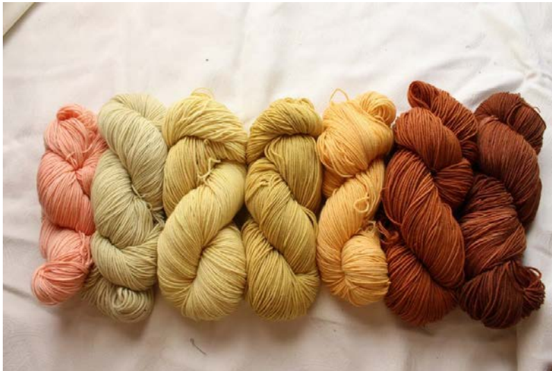
Einer von vielen Kreativangeboten: Färbe-Workshop mit Pflanzenfarben am 7. Juli

Breiten Raum im Veranstaltungsreigen mit insgesamt 38 Einzelterminen nehmen die Kreativ- und Entspannungsangebote ein. Auch hier kann aus einer bunten Vielfalt ausgewählt werden: Garten-Workshops (Gartenplanung, Garten- und Balkonbepflanzung, Obstbaum-Veredeln, Pflanzenbestimmen, Sensen-Mähen und Dengeln, Adventkranz-Binden), Kunst-Workshops (Chinesisches Pflanzenmalen, Ikebana, Botanische Illustration) und Kräuter-Workshops (Wildkräuter im Frühling, Heilkräuter, Kräuter-Kosmetik, Räuchern). Erstmals wird ein Färbe-Workshop mit Pflanzenfarben aus dem Garten angeboten. Und auch der Genuss kommt nicht zu kurz: Gemeinsam mit Slow Food Oberösterreich wird zu einer botanisch-kulinarischen Entdeckungsreise zu den Wurzeln des Geschmacks geladen.