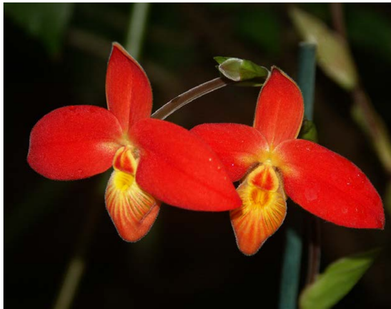
Eine Besonderheit unter den Frauenschuh-Arten: Phragmipedium besseae aus Peru. Die Blütenfarbe Rot ist bei Frauenschuh-Orchideen äußerst selten!