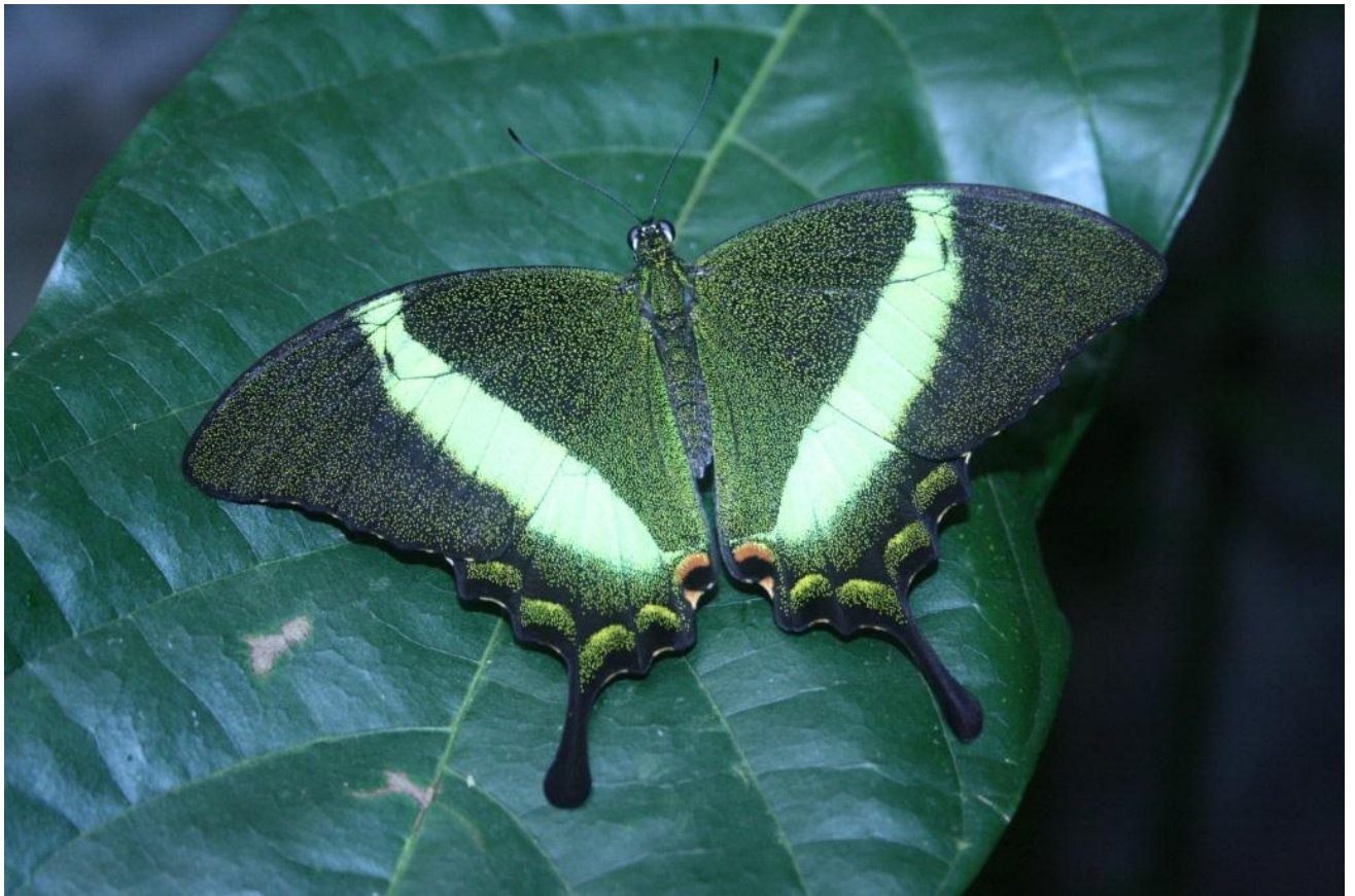
Ab 16. November flattern wieder die Tropischen Schmetterlinge!