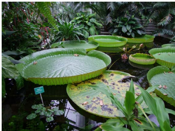
Riesenblätter der größten Seerose der Welt – Victoria cruziana

Der Hochsommer ist da und mit ihm die Ferien- und Urlaubszeit. Ob auf einer Reise in andere Weltgegenden, in heimischen Gefilden oder einfach nur am Balkon oder im Garten: Genießen Sie die unbeschwerten Tage und tanken Sie Energie für den kommenden Herbst und das restliche Jahr! Für einen Kurzurlaub vor der Haustür steht der Botanische Garten immer zur Verfügung. Hier können Sie sogar eine botanische Weltreise unternehmen, ohne das Flugzeug besteigen zu müssen: Wie wär's zum Beispiel mit einer Tour durch den Linzer Tropenwald vor dem Eingang zu den Glashäusern?