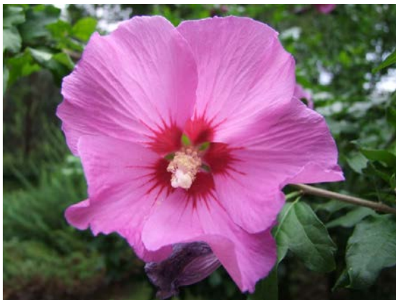
Garten-Hibiskus Sorte „Russian Violet“

Als botanische Highlights der Saison möchte ich zwei Pflanzengruppen erwähnen, die jetzt im Hochsommer optimal entwickelt sind. Bei beiden handelt es sich um Sträucher, die wegen ihres Blütenschmucks als Zierpflanzen in vielen Gärten kultiviert werden. Der Garten-Hibiskus oder Eibisch ( Hibiscus syriacus ) bildet große, trichterförmige Blüten in den Farben Weiß, Gelb, Rosa, Blau, Violett oder Dunkelrot aus. Die Heimat dieser zu den Malvengewächsen zählenden Gattung ist das tropische und subtropische Südostasien. Dementsprechend ist der Hibiskus zwar Wärme liebend, jedoch bei uns durchaus winterhart.