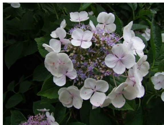
Teller-Hortensie Sorte „Libelle“

Die zweite Gruppe betrifft die Hortensien ( Hydrangea ), die mit schirm-, rispen- oder ballartigen Blütenständen zu den Stars unter den Sommerblühern zählen. Typisch für die Gattung ist, dass die meisten Arten sterile, auffällig vergrößerte Randblüten bilden, die zur Verbesserung der Schauwirkung für die Blütenbesucher dienen. Die eigentlichen, zur Fortpflanzung dienenden Blüten sind hingegen relativ klein und unscheinbar. Das ursprüngliche Verbreitungsgebiet der rund 70 wild vorkommenden Hortensienarten erstreckt sich über die gemäßigten Regionen Süd- und Ostasiens, sowie Nord- und Südamerika. Besonders auffällig sind die Züchtungen aus der Art Hydrangea macrophylla und die Rauhblatt-Hortensie ( Hydrangea aspera ), deren Blätter sich wie ein Plüschtier anfühlen.