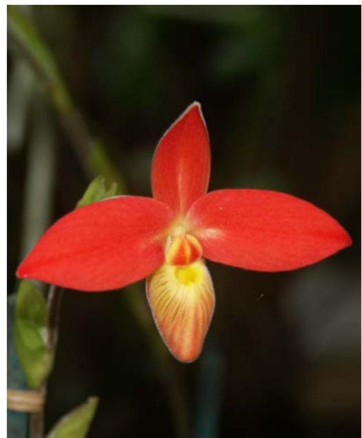
Südamerikanischer roter Frauenschuh