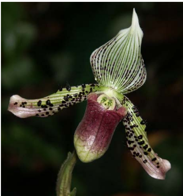
Asiatischer Frauenschuh Paphiopedilum argus

Derzeit haben eindeutig die Orchideen Hochsaison. Die Ausstellung „ Zauberwelt der Orchideen – märchenhaft und mystisch “ hat noch bis Sonntag, 11. März geöffnet. Der Botanische Garten Linz besitzt ja eine überaus artenreiche Sammlung mit ca. 1.100 verschiedenen Arten und Sorten. Ein besonderer Schwerpunkt liegt bei den Wildarten von Frauenschuhorchideen.