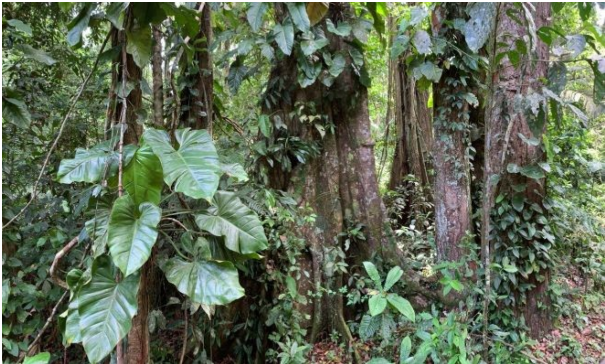
Vortrag über Costa Rica und den Regenwald der Österreicher am 17. März

In Kooperation mit der Volkshochschule finden vielseitige Vorträge statt. Die Bandbreite reicht von „Schönheit in der Natur – und vice versa“ über „Costa Rica und der Regenwald der Österreicher“, „Pflanzensymbolik – Die alte Sprache der Blumen“ bis hin zur „Fledermausnacht“.