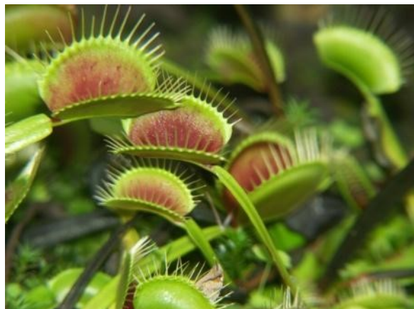
Orchideen und fleischfressende Pflanzen stehen im Mittelpunkt von Sonderausstellungen im Jahr 2022