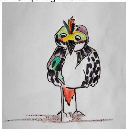
Kindertheater „Pici, der kleine Specht“ Von Ulrike Mair mit Schüler*innen der Montessori Schule Schola (30. Juni, 1. u. 5. Juli)

Auch für das jüngere Publikum hat der Botanische Garten passende Angebote parat. Damit sollen die Freude und das Interesse an der Natur, der Flora und Fauna gefördert werden. Erstmals wird es ein Kindertheater zu bewundern geben. „ Pici, der kleine Specht “ wird von Kindern der Montessori-Schule Schola aufgeführt. Ein Naturspietag steht ebenso auf dem Programm wie beispielsweise ein Workshop mit dem Titel „ Schokolade wächst an Bäumen “, in dem Kinder erfahren, wo Kakao und andere Lebensmittel ihren Ursprung haben.