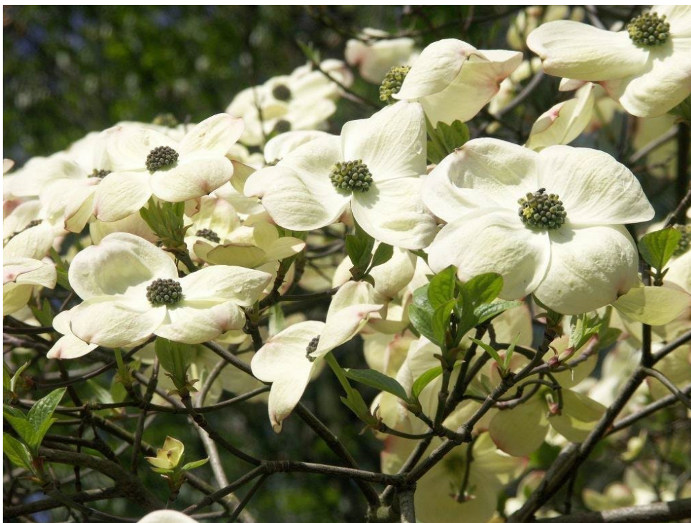
Amerikanischer Blumenhartriegel ( Cornus nutallii )

Wir können nur auf einige besonders auffällige und bemerkenswert blühende Pflanzen hinweisen, die sich derzeit präsentieren. Im Senkgarten in der Nähe des Eingangs sind es v.a. die prächtigen Blumenhartriegel ( Cornus florida und C. nutalli ) aus Nordamerika, die in Weiß und Rosa erstrahlen. Demnächst öffnet auch der asiatische Hartriegel Cornus kousa seine Blüten. Im Senkgarten erstrahlen auch die verschiedenen Polsterpflanzen in den schönsten Farben: Phloxe in unterschiedlichen Blautönen, Steinkresse ( Aurinia ) in leuchtendem Gelb und Schleifenblume ( Iberis ) in strahlendem Weiß.