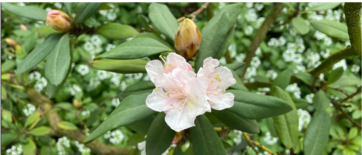
Kaukasus Rhododendron ( Rhododendron caucasicum Melpomene)

Der Botanische Garten präsentiert sich derzeit mit einer großen Blütenvielfalt. Der kürzlich eingetretene Schlechtwettereinbruch hat zwar die Blüte der Magnolien und anderer Pflanzen eingebremst, doch die Frühlingsblüher lassen sich nicht aufhalten: Tulpen, Narzissen, Hyazinthen und vieles mehr gibt es zu entdecken. Emsig sausen bei Schönwetter Wildbienen, Honigbienen und Hummeln herum, um Nektar und Pollen zu sammeln und dabei die zahlreichen Blüten zu bestäuben. Frösche und Kröten haben ihren Laich in unserem Teich abgelegt und die vielen Vogelarten im Garten bescheren uns jeden Morgen ein lautes Konzert. Auch die Blüte verschiedener Rhododendren und anderer Sträucher hat begonnen. Der Name Rhododendron kommt von rhodon = „Rose“ und dendron = „Baum“. Es handelt sich um eine sehr alte Pflanzenart, die bereits ab dem Tertiär zu finden ist und in Asien, Nordamerika, Europa und Australien verbreitet ist. Seit 1850 werden Rhododendren kultiviert, weltweit sind 1.150 Arten beschrieben. Im Botanischen Garten blühen zahlreiche Rhododendron-Arten ab Mai bis in den Sommer, von denen die ersten Blüten bereits jetzt zu sehen sind. Ich freue mich auf Ihren Besuch!