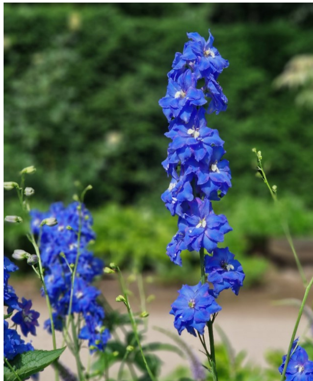
Hoher Rittersporn ( Delphinium elatum „Jubelruf“)

Die Sommersonnenwende liegt bereits hinter uns, und die Tage beginnen kürzer zu werden. Mit dem astronomischen Beginn des Sommers steht uns auch die Blütezeit vieler Sommerblüher bevor. Die Knospen von Hortensien ( Hydrangea ) sind gerade dabei sich zu öffnen und mit ihren sterilen Schaublüten, die botanisch gesehen Kelchblätter sind, die Blicke auf sich zu ziehen. In den Beeten beim Hufeisenteich und im Senkgarten sind es die Sommerstauden mit den zur Jahreszeit passenden Namen „Sonnenröschen“ ( Helianthemum ) und „Sonnenaugen“ ( Heliopsis ). Es folgen gelbe Kissen von Mädchenaugen ( Coreopsis ), blaue Kerzen von Glockenblumen ( Campanula ), Rittersporen ( Delphinium ) und Funkien ( Hosta ).