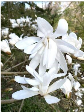
Stern-Magnolie ( Magnolia stellata )

Es ist ganz offensichtlich: der Frühling ist da, und der Botanische Garten erblüht in den kräftigsten Farben. Neben Narzissen, Krokussen und Tulpen zeigen insbesondere die Forsythien und Magnolien ihre ganze Pracht. Passend zum Themenschwerpunkt „Frühjahrserwachen“ wurden auch die Zierbeete gestaltet. Außerdem laden im gesamten Freiland zahlreiche Sitzgelegenheiten zum Verweilen und Genießen ein.