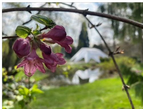
Weigelie ( Weigelia praecox )