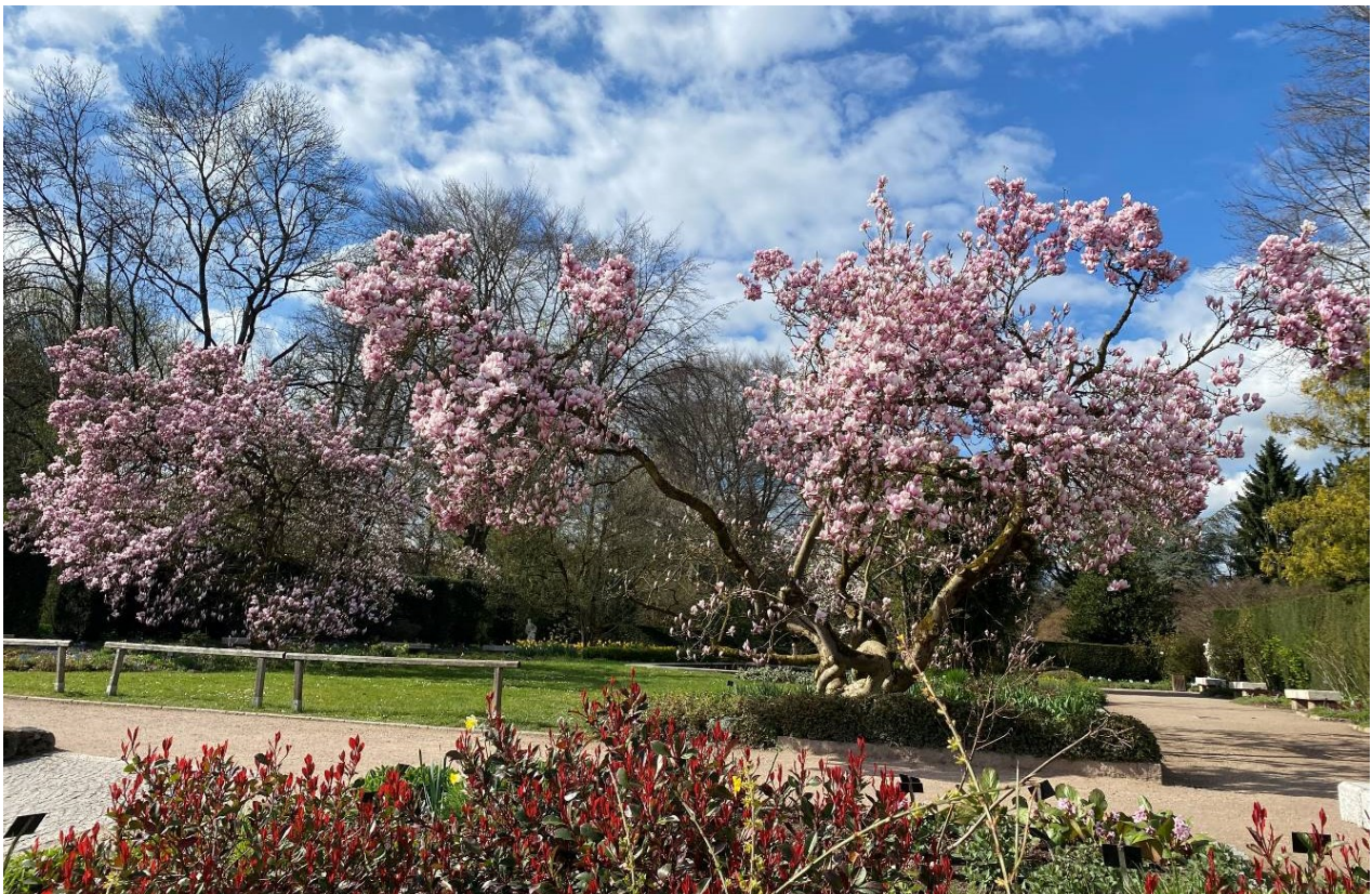
Den Eingangsbereich ziert die äußerst beliebte Tulpen-Magnolie ( Magnolia x soulangeana ).

Die Familie der Magnoliengewächse (Magnoliaceae) ist nach heutigem Wissensstand übrigens die älteste Blütenpflanzen-Familie der Erde. Vermutlich gab es sie schon vor über 100 Millionen Jahren. Sie steht in der Entwicklungsgeschichte der Bedecktsamer, also aller bekannten Laubgehölze, Stauden und Gräser, ganz am Anfang. Auf dem europäischen Kontinent ist sie mit dem Beginn der Eiszeiten ausgestorben und nunmehr in Ostasien sowie Nord- und Mittelamerika beheimatet.